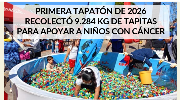
PRIMERA TAPATÓN DE 2026 RECOLECTÓ 9.284 KG DE TAPITAS PARA APOYAR A NIÑOS CON CÁNCER

Las clases se impartirán de manera virtual y estarán a cargo del Centro de Formación Superior CRECE, que otorgará títulos avalados por la Bussines School de la Universidad Autónoma Gabriel René Moreno.